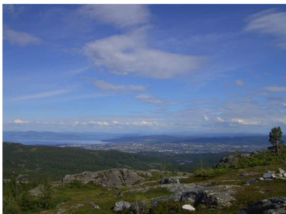
De stad en het fjord vanuit Bymarka