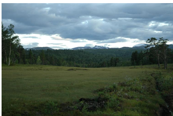
Trollhetta in het avondlicht (met sneeuw!)