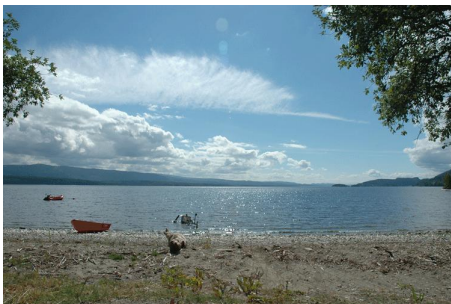
Zo lijkt werken toch best op vakantie...