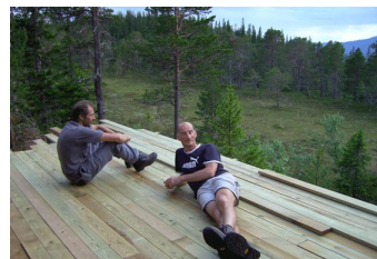
Na gedane arbeid...

De zondag erna, 1 juli, zijn we naar Herberndammen geweest, een van onze favoriete meertjes in Bymarka. Het was prachtig weer, dus we hebben lui aan het water gelegen met een boek, af en toe