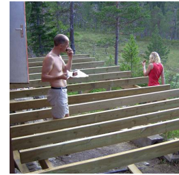
Het begin is er...

nam het meeste tijd in beslag, maar aan het einde van de dag konden we dankzij een prima samenwerking toch kijken naar een mooi resultaat. Het fundament verankerd, alle vloerplanken op maat, alleen nog vastzetten en de reling maken. Maar dat is voor de familie zelf, 'n volgende keer ☺.