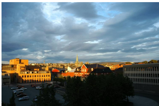
Zicht vanaf ons balkon, 4 juli 22.30 uur

Waar we 's avonds erg van kunnen genieten deze zomermaanden, is het licht buiten. Het stenen theater aan de overkant en het 'Sukerhuset' lichten dan prachtig oranje op, de kathedraal grijs en kopergroen, en de lucht paars-blauw. Ook nu zijn de dagen nog lang en is het nog niet donker als we ons bed opzoeken.