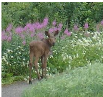
Éénjarige eland bij de universiteit