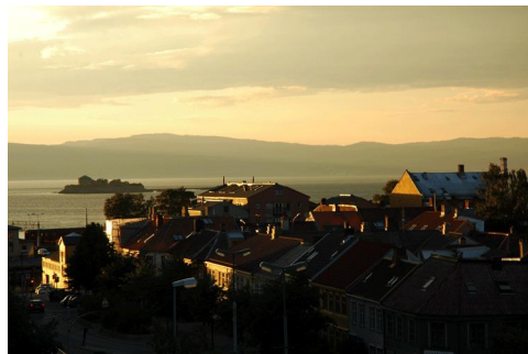
Zicht vanaf ons balkon, 4 juli 23.30 uur

Waar we 's avonds erg van kunnen genieten deze zomermaanden, is het licht buiten. Het stenen theater aan de overkant en het 'Sukerhuset' lichten dan prachtig oranje op, de kathedraal grijs en kopergroen, en de lucht paars-blauw. Ook nu zijn de dagen nog lang en is het nog niet donker als we ons bed opzoeken.