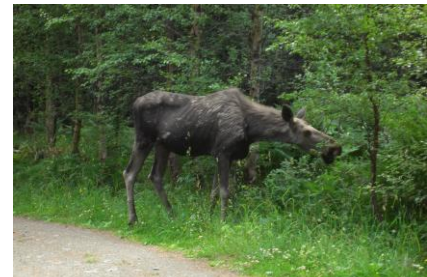
Tweejarige eland in Bymarka