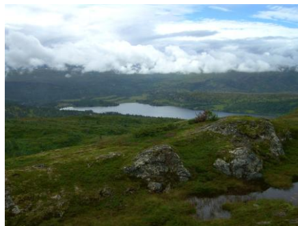
Uitzicht op Resavatnet vanaf Mjuken

een hapje. Daarna gegeten en nog een wandeling gemaakt naar het meertje vlak in de buurt. Mira, de hond, heeft zich prima vermaakt en liet zich steeds weer voor een stok het water insturen ☺️. Zaterdagochtend hebben we eerst uitgeslapen, daarna ontbeten en vervolgens zijn we op pad gegaan richting 'Resfjellet'. Het weer viel alles mee, we hadden alleen op het eind een buitje. We hebben heerlijk gelopen over paadjes, door moerasgebieden en over rotsblokken.